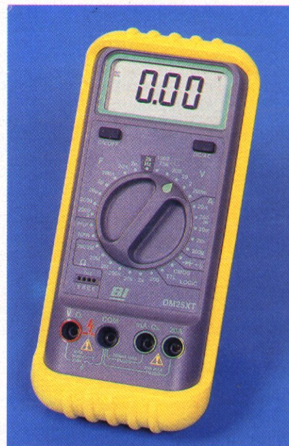
Photo 2. - Le multimètre DM 25 XT.

La sonde thermocouple est à relier aux entrées prévues à cet effet. Le sélecteur rotatif est à placer sur l'un des quatre calibres suivants : - 200 °C,